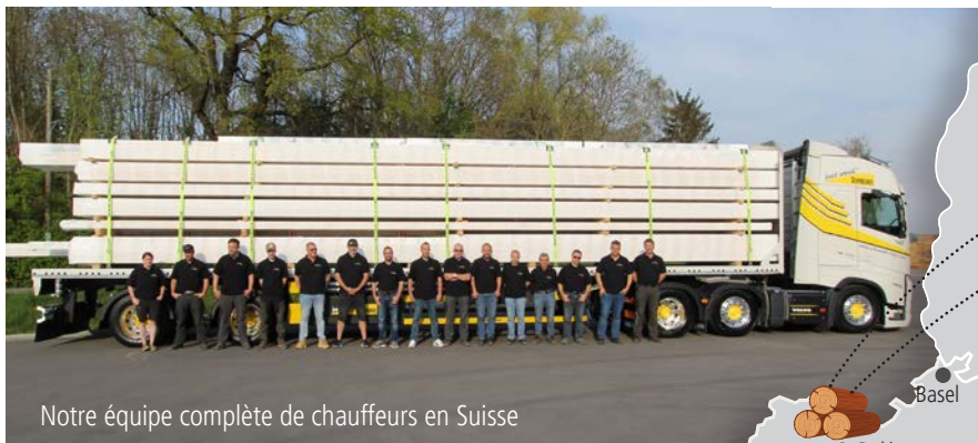
Notre équipe complète de chauffeurs en Suisse