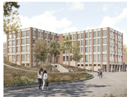
Genossenschaft Thujastrasse, 500 m 2