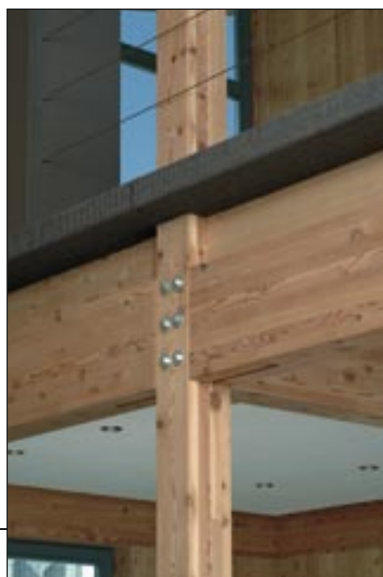
Réalisations en mélèze d'Autriche.